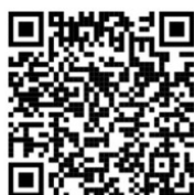
Intrare (823 m)