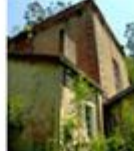
Central del Eume