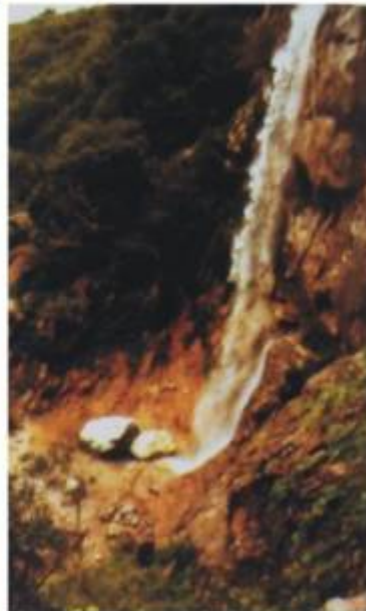
Rápel 26: Febrero 1998

TOPOGRAFIA ORIGINAL 1998: BALTASAR FELGUERA MODIFICADO 2007: CHEMA GOMEZ G.E.A CAMPILLOS